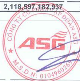
Dương Đức Tính Chủ tịch Hội đồng quản trị